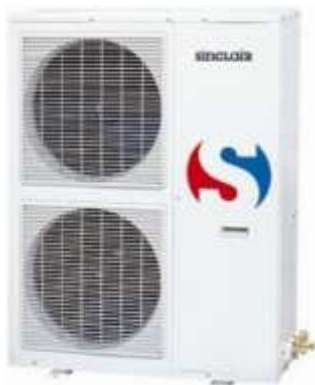
POMPA CIEPŁA POWIETRZE WODA JEDNOSTKA ZEWNĘTRZNA GSH-140ERA